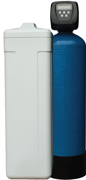
Humusfilter med salttank