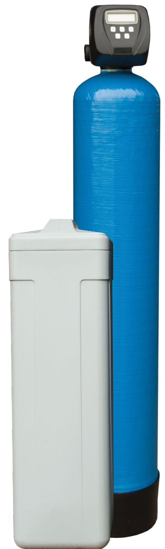
Kombinationsfilter med salttank