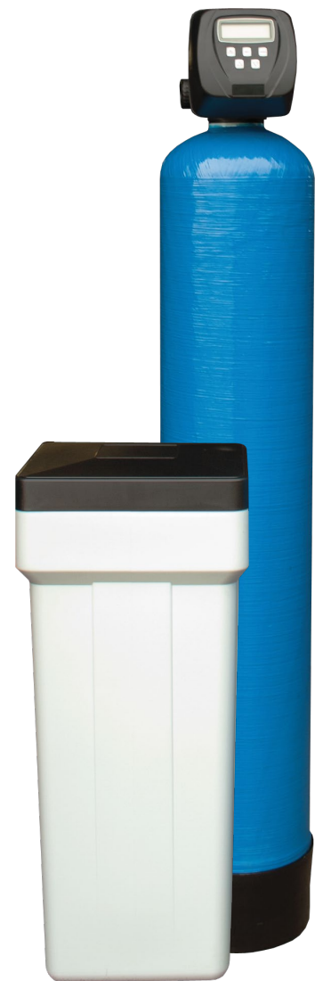
Kombinationsfilter med salttank

Därefter väljer vi tillsammans ett filter som har rätt mängd filtermassa då detta bestämmer hur ofta filtret ska regenereras, vilket förbrukar salt. Mängden är avvägd mot den totala hårdhet som finns i vattnet.