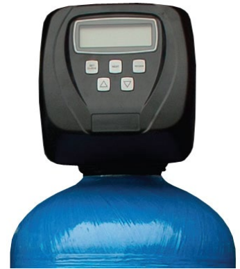
Avancerat styrsystem med flödesmätare