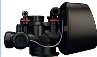
Ventil för att ställa in hårdhet